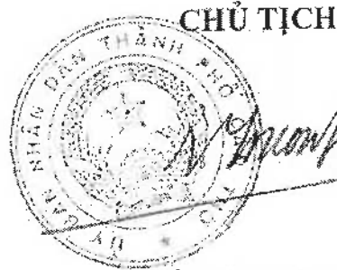
Trần Việt Trường